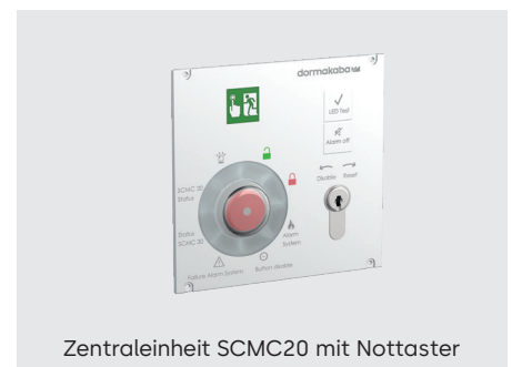
Zentraleinheit SCMC20 mit Nottaster