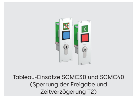
Tableau-Einsätze SCMC30 und SCMC40 (Sperrung der Freigabe und Zeitverzögerung T2)