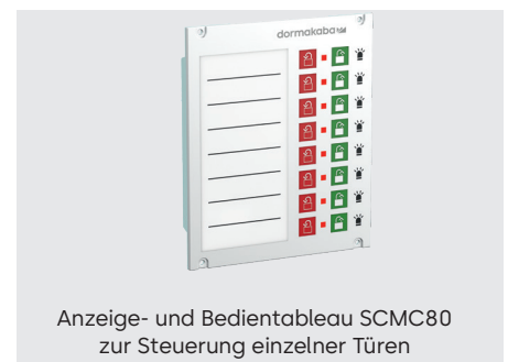
Anzeige- und Bedientableau SCMC80 zur Steuerung einzelner Türen

Mit den SCMC (SafeRoute Central Managemet Control) Tableausystemen können einzelne Türen, Türgruppen und räumliche Abschnitte in Echtzeit überwacht und gesteuert werden. Je nach Anforderung kann ein Tableausystem gemäß EN 13637 durch modulare Kombination von Tableaeinsätzen individuell zusammengestellt und der jeweiligen Objktanforderung angepasst werden.