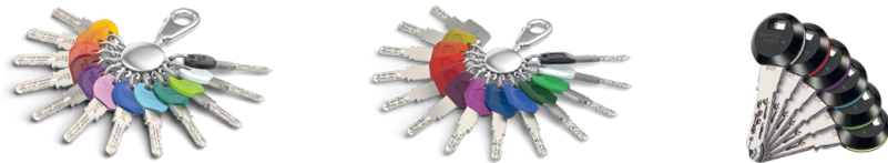
Für den Standardschlüssel gibt es Smartkey-Clips in 12 Farben.