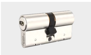
VPP – verfügbar für revy 10 / 20 / 30