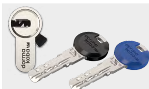
SUZ – verfügbar für revy 20 / 30