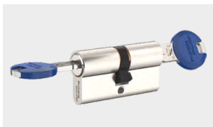
BSZ – verfügbar für revy 10 / 20 / 30