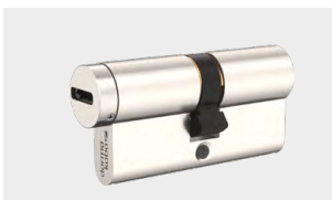
SIS – verfügbar für revy 20 / 30